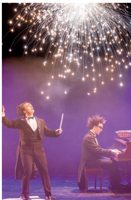
Les Virtuoses Samedi 25 septembre à l'Abaca