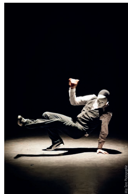
Ballet 2 rue Vendredi 5 novembre à l'Abaca