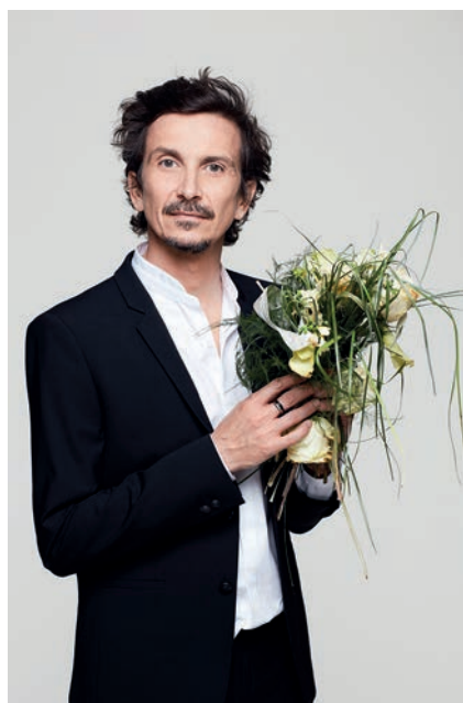
Arnaud Tsamère Samedi 3 avril à l'Abaca

Toutes les dates et manifestations sont données sous réserve de modification et de nouvelles mesures sanitaires.