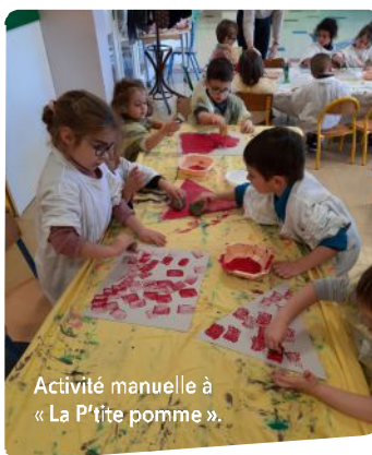
Activité manuelle à « La P'tite pomme ».

Les membres de la sous-commission cantine mangent régulièrement, à tour de rôle à la cantine en alternant également les services. À noter qu'un parent de chaque école, membre du conseil d'école, est également invité à manger à minima une fois par trimestre. Nouveauté janvier 2022, l'appli Intramuros vous permet de signaler les absences cantine.